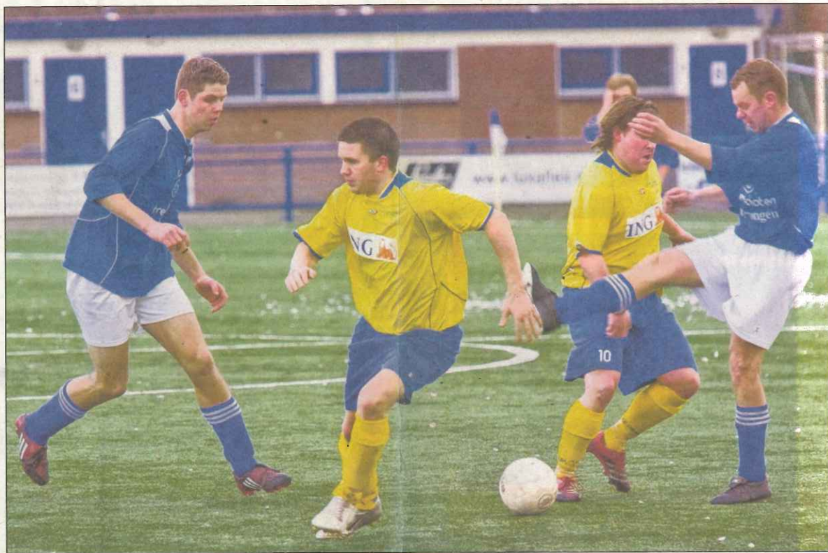
In een wedstrijd zonder echte hoogtepunten hielden DVSA en Delta Sports uit Houten elkaar in evenwicht.

In het verdere verloop van de eerste helft waren er over en weer wel mogelijkheden, maar van enig voetbalverband was absoluut geen sprake. Met name de vele corners die DVSA kreeg toegewezen waren