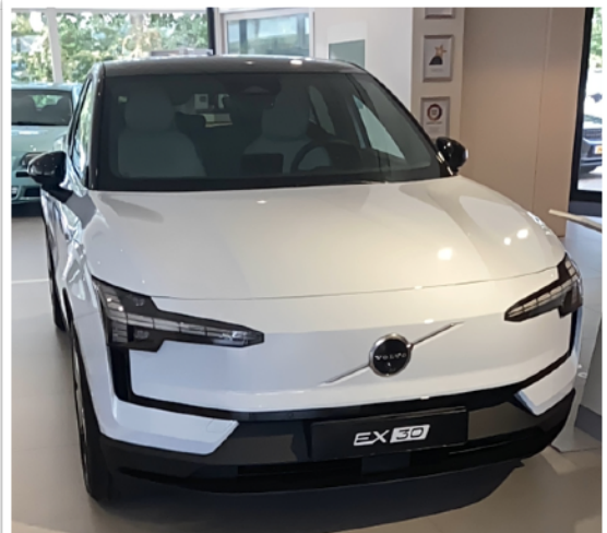
De Volvo EX30 is vooral bij jongeren in trek

Overweegt u aanschaf van een Volvo of occasion? Loop dan zeker even bij Volvo Reede binnen.